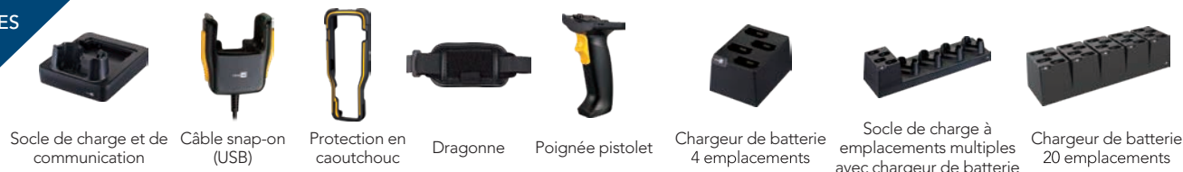
Socle de charge et de communication