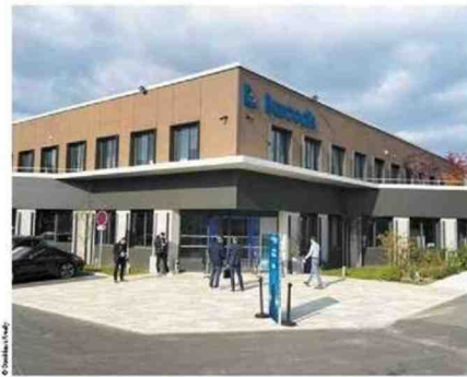
Vue de l'entrée du nouveau site Barcodis à Villébon-sur-Yvette.

Parallèlement, il fallait simplifier la mise à jour des étiquettes qui sont grâce à 3 km de la ligne d'ensachage, sans oublier la prise en compte de la traçabilité qui, de nos jours, est devenue incontournable.