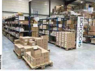
L'atelier avec les stocks des matières destinées à la production.