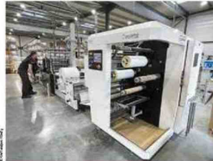
La zone de production avec les étiqueteuses.